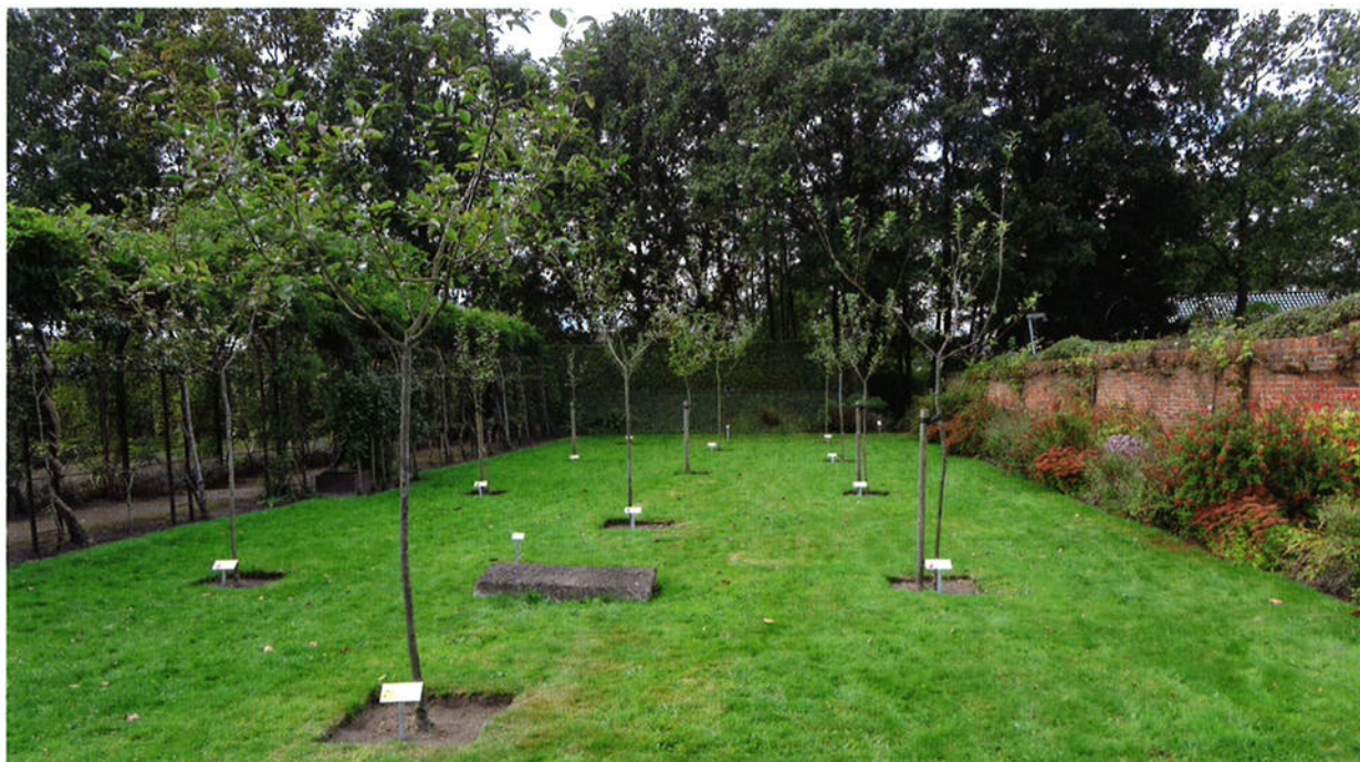
De westelijke Appelhof en de slangenmuur.