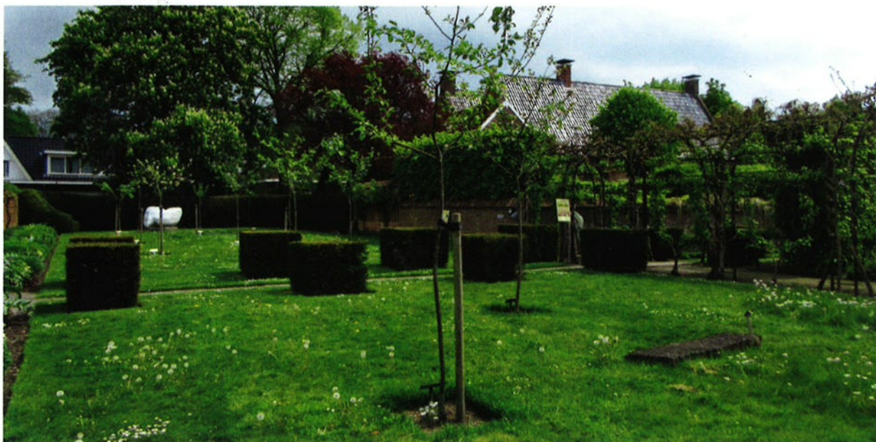
De Appelhof met op de achtergrond het Nijsinghuis.

appelhof met 255 bomen in 36 rijen beschreven, waarvan per boom alle details vermeld werden.